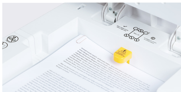
Destruye documentos con clips y grapas