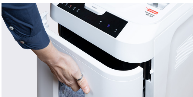
Gran papelerera de 32 litros