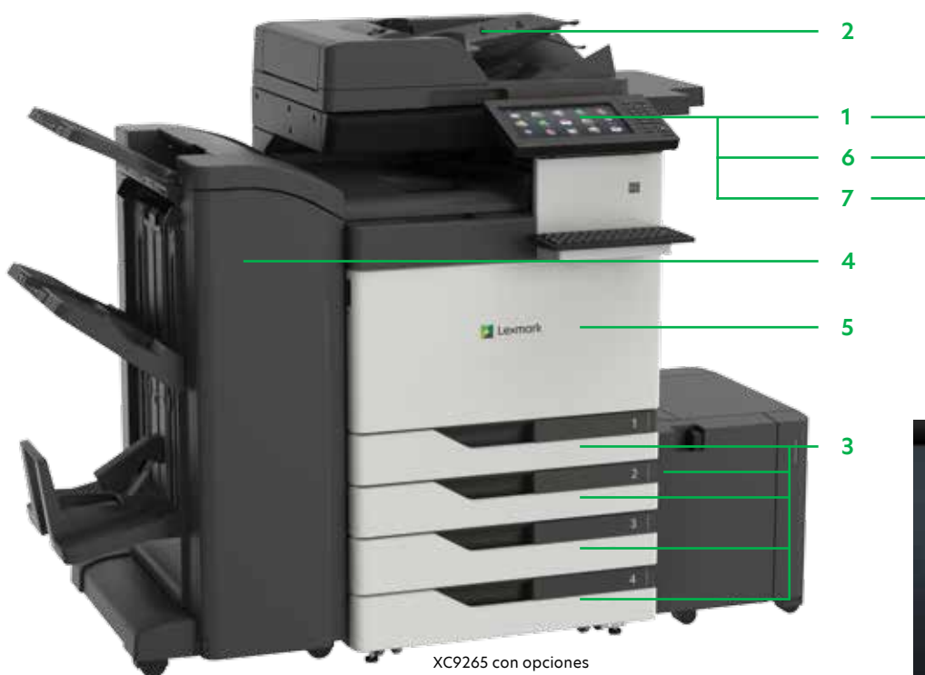
XC9265 con opciones

Imprima archivos de Microsoft Office, PDF y otros tipos de imágenes y documentos desde unidades flash, o seleccione e imprima documentos desde servidores de red o unidades en línea.